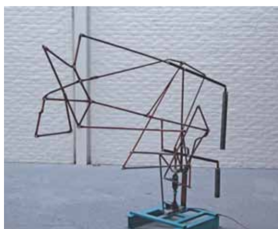
Bart Nijboer, Object 1 .