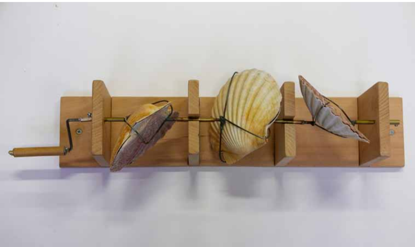
Nico Parlevliet, Swinging scallops .

Het sprongetje van Surplace naar A one minute square in 12 hours van Cas Beijers is snel gemaakt. Ook hier speelt tijdsbesef een belangrijke rol en tegelijkertijd maakt de Rotterdamse kunstenaar duidelijk dat alledaagse objecten en bezigheden onverwachte kanten kunnen openbaren. Vier doodgewone wandklokken vormen samen een perfect vierkant zodra de wijzers van de klokken in keurige hoeken van 90 graden tegenover elkaar (of: in elkaars verlengde) staan. Het vierkant is slechts   n minuut te zien. Daarna moet de toeschouwer 12 uur wachten totdat de volgende 'one minute of perfection' zich aandient. De welhaast contemplatieve ervaring van tijd en evenwicht vergt veel geduld en uithoudingsvermogen. Niets gaat vanzelf en zonder inspanning!